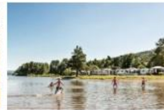
Bærekraftige opplevelser i Innlandet