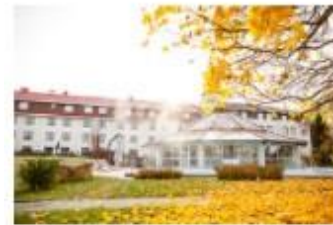
Bærekraftig overnatting i Innlandet

Turisme har mange positive sider, men byr også på utfordringer. Vil du reise til et unikt sted som både legger til rette for et miljøtrykket ditt blir så minimalt som mulig, og for at du skal få en mest mulig autentisk opplevelse? Og som i tillegg tar ansvar for at både de som bor der og besøkende skal ta det ekstra bra? Da anbefaler vi å besøke et reisemål med fokus på en mer bærekraftig utvikling. På denne måten bidrar du til å støtte opp om både lokalsamfunn og kulturarv.