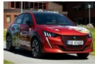
Ut på elbilferie