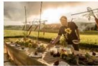
Utsalg av kortreist mat