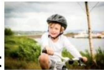
Friluftsliv og turforslag